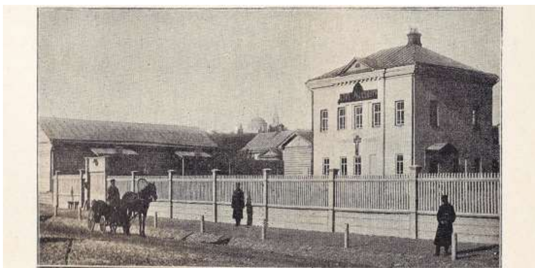
Дома трудолюбия. Орловский дом трудолюбия. Видъ съ Никитской улицы. Съ фот. Денисова въ Орлѣ, авторитетъ „Инци“